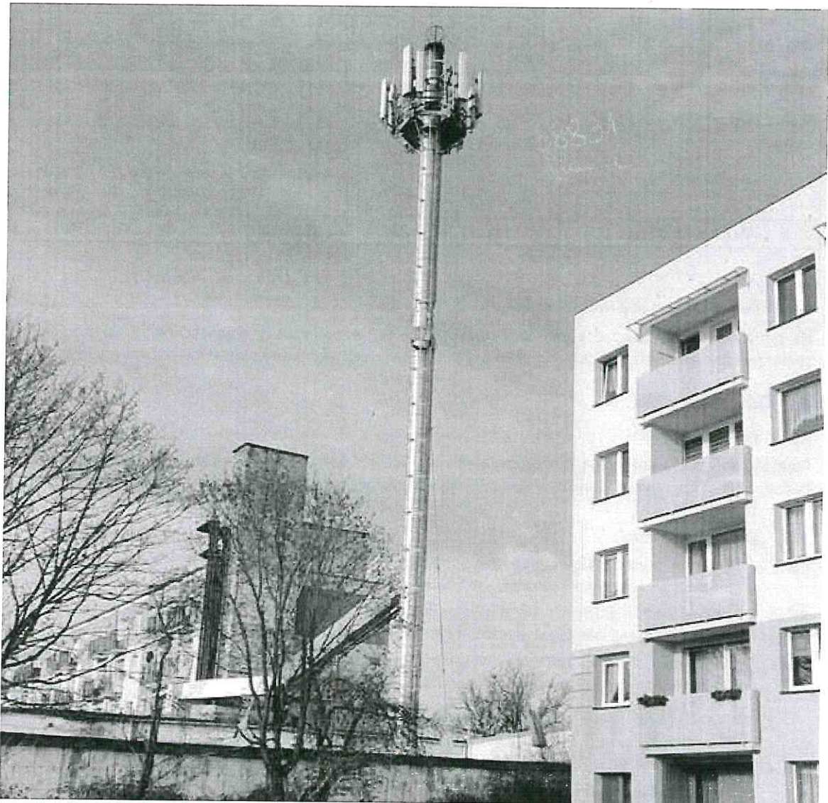
Zdjęcie 1 Badany obiekt