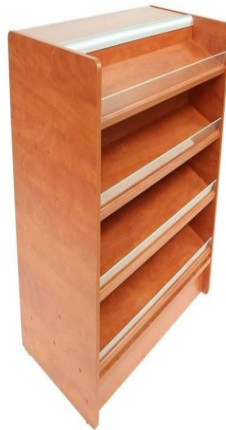
Rysunek poglądowy lady sprzedażowej