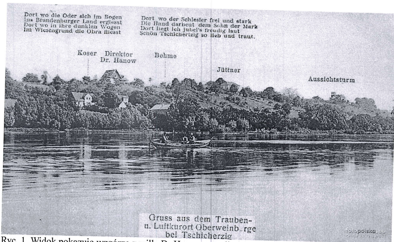
Ryc. 1. Widok pokazuje wzgórze z willą Dr Hanow – czyli obecna Sala Wiejska, nie istnieje jeszcze późniejszy główny budynek Ośrodka – Restauracja Wzgórze Heleny. Widoczne poniżej: budynek Koser – przystań rybacka i obok - Willa Jüttner tak jak i wieża widokowa – zniszczone podczas działań wojennych w 1945 r. Zdjęcie wykonano prawdopodobnie w II połowie XIX w.

Jako uzupełnienie Petycji z dnia 21.04.2017 r. przedstawiamy: