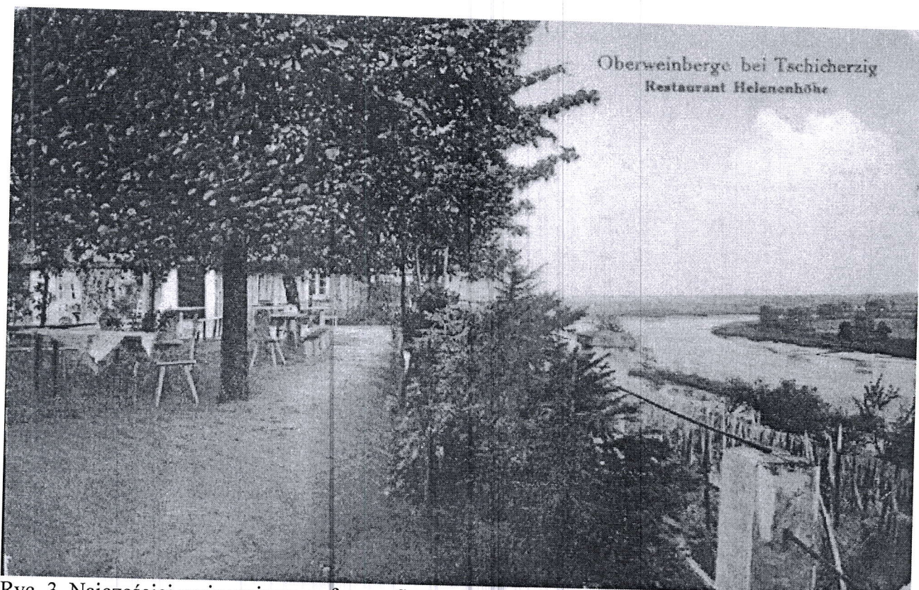
Ryc. 3. Najczęściej uwieczniany na fotografiach widok z Oberweinberge (niem. Górzykowo) zakręt Odry. Na początku XX w. wzgórze od znajdującej się w głównym budynku późniejszego Ośrodka Restauracji nosiło nazwę Helenenhöhe (Wzgórze Heleny). Widoczne istniejące jeszcze słupki tarasu zejściowego – na terenie działki nr 154.