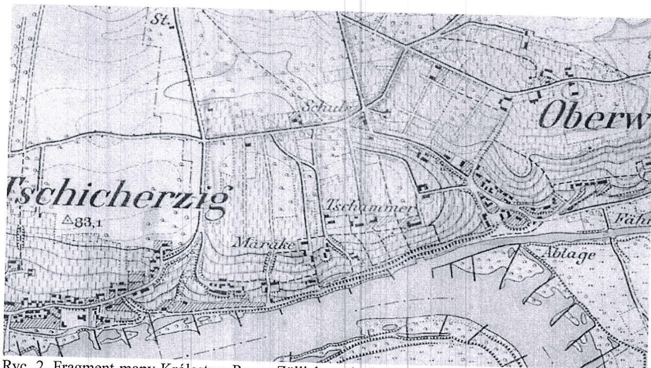
Ryc. 2. Fragment mapy Królestwa Prus - Züllichau obręb 2191 z roku 1894. Widoczne wzgórze z budynkiem Restauracji Marake oraz z naniesionymi budynkami obecnego kompleksu nieruchomości nr 54.